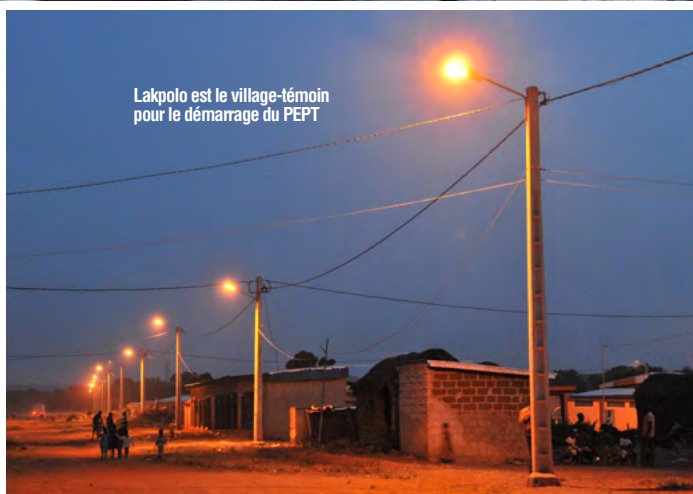
Lapkolo est le village-témoin pour le démarrage du PEPT