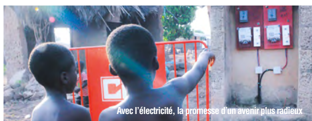
Avec l'électricité, la promesse d'un avenir plus radieux