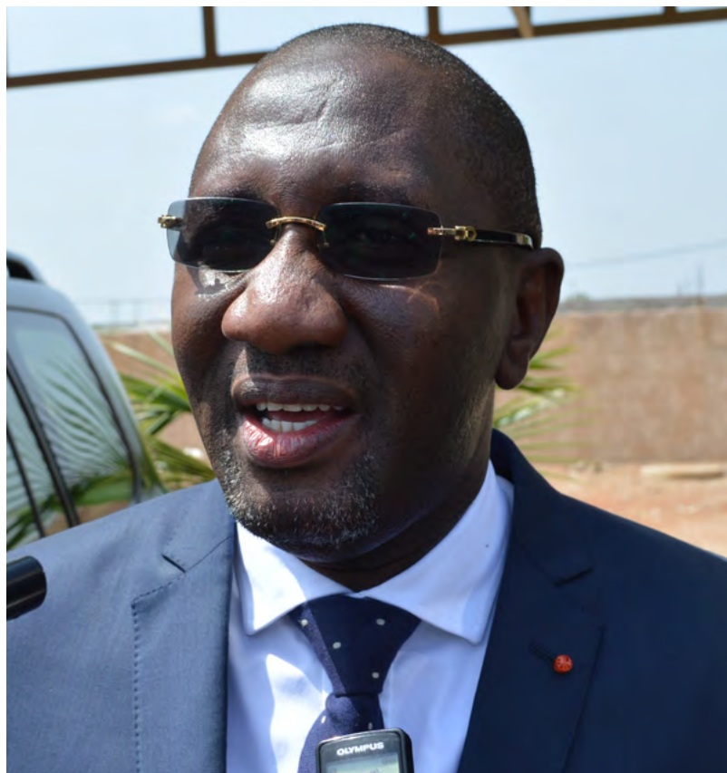
Souleymane Diarrassouba Ministre du Commerce, des PME et de la promotion de l'artisanat