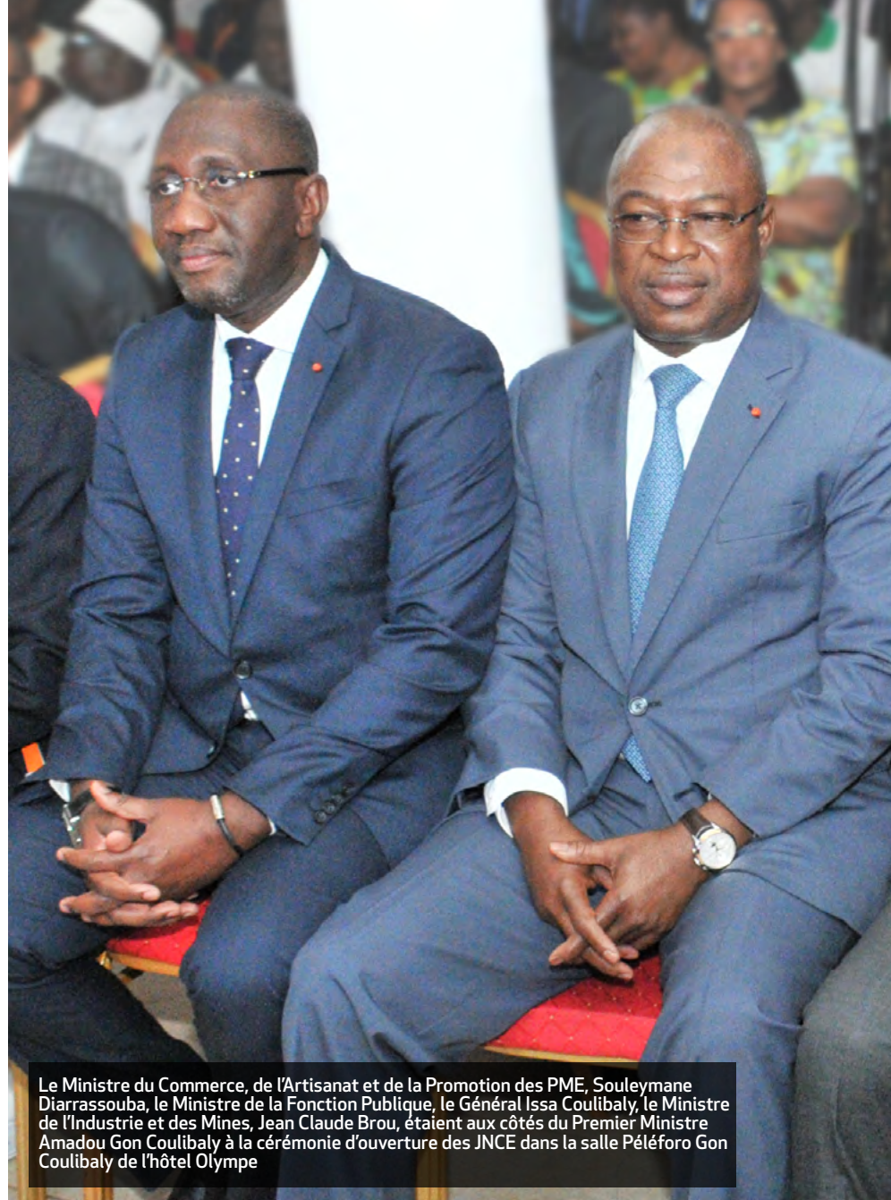
Le Ministre du Commerce, de l'Artisanat et de la Promotion des PME, Souleymane Diarrassouba, le Ministre de la Fonction Publique, le Général Issa Coulibaly, le Ministre de l'Industrie et des Mines, Jean Claude Brou, étaient aux côtés du Premier Ministre Amadou Gon Coulibaly à la cérémonie d'ouverture des JNCE dans la salle Péléforo Gon Coulibaly de l'hôtel Olympe