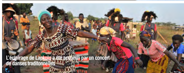
L'éclairage de Lapkolo a été accueilli par un concert de danses traditionnelles